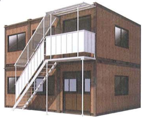
東北地方は檜柄となります。